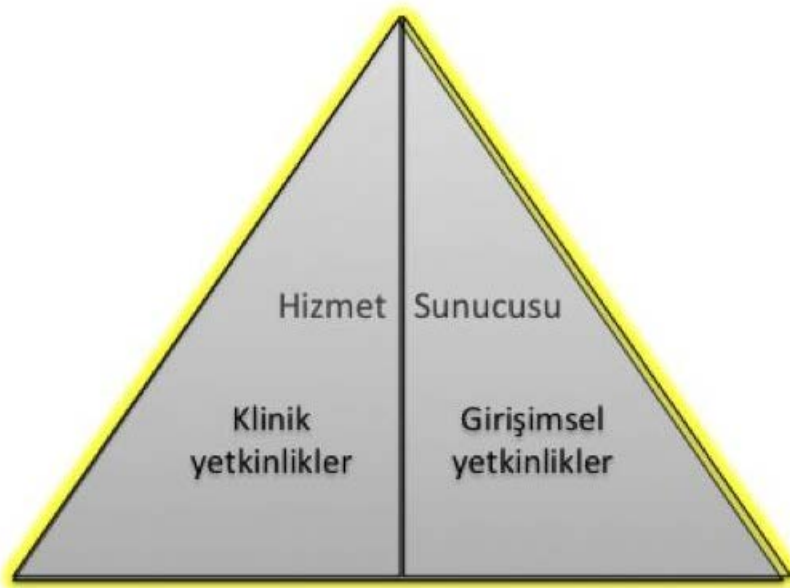
Şekil 2. Hizmet Sunucusunun iki bileşeni